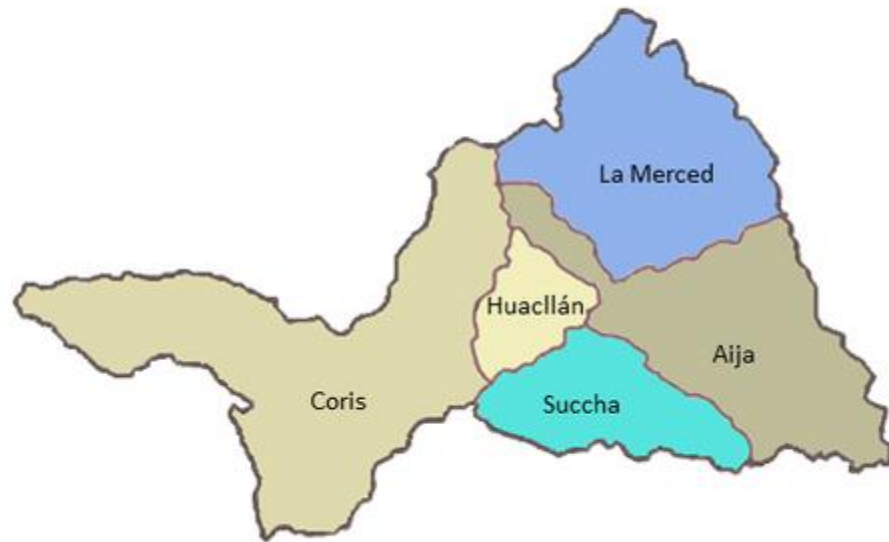
Distritos de la provincia de Aija