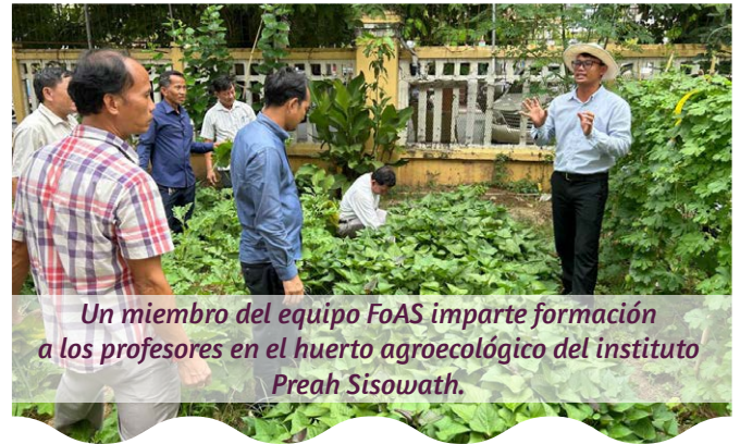
Un miembro del equipo FoAS imparte formación a los profesores en el huerto agroecológico del instituto Preah Sisowath.

El proyecto trabaja con tres escuelas secundarias: la escuela secundaria Preah Sisowath, la escuela