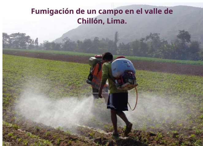
Fumigación de un campo en el valle de Chillón, Lima.

Más que nunca, necesitamos seguir desarrollando y defendiendo alternativas al modelo dominante, en particular la agricultura familiar agroecológica y los sistemas alimentarios locales. Nuestros socios peruanos están trabajando duro para conseguirlo. A nivel local, trabajando con las comunidades en la gestión sostenible del territorio y la agroecología, como está haciendo DIACONIA en Ancash. Y a nivel nacional, a través de la incidencia y la sensibilización. Por ejemplo, KUSKA, un festival de 3 días organizado en Lima en octubre de 2023 por nuestro socio CAP y otros actores, pretende ser un foro de encuentro entre ciudadanos, consumidores, productores agroecológicos y actores públicos y privados para sensibilizar sobre el consumo responsable de alimentos sanos.