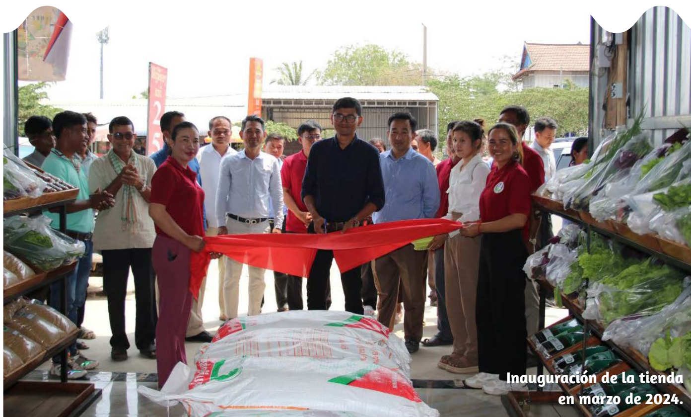
Inauguración de la tienda en marzo de 2024.

Con el apoyo del proyecto PARTNER, la Unión de Cooperativas Agrícolas de Tramkak (TrUAC) abrió en marzo de 2024 una tienda en sus locales para establecer un vínculo directo entre los productos agroecológicos de los agricultores y los consumidores. Este comercio al por menor, creado por los agricultores, aún tiene un largo camino por recorrer. Si consigue mantenerse, más personas tendrán acceso a productos locales y sanos, y más agricultores adaptarán las prácticas agroecológicas.