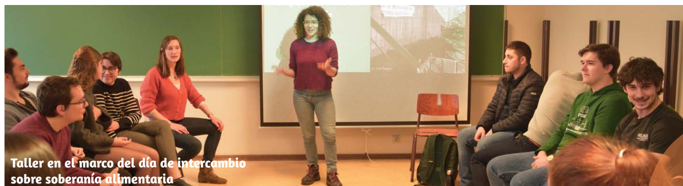
Taller en el marco del día de intercambio sobre soberanía alimentaria

La materialización de nuestra dimensión universitaria en nuestras acciones, en beneficio de las poblaciones con las que trabajamos, también sigue estando en el centro de nuestra reflexión estratégica: así es como intentamos progresar, traducir nuestra dimensión de ONG que aprende y refuerza vínculos con la Universidad de Lieja y otros actores universitarios. Esta dimensión fue objeto de una profunda reflexión entre nuestros equipos y algunos miembros del Consejo de Administración durante nuestro último taller estratégico 2023. Estas reflexiones (y otras) están guiando la profundización y la intensificación de nuestras acciones con los actores universitarios.