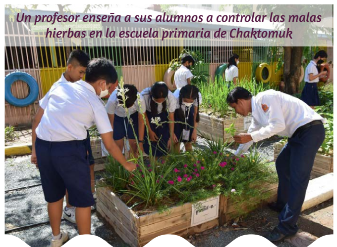
Un profesor enseña a sus alumnos a controlar las malas hierbas en la escuela primaria de Chaktomuk

Los huertos agroecológicos también se han convertido en puntos de encuentro para el personal de las escuelas y los padres, que acuden a conectar con la naturaleza al final del día. Los cuatro huertos agroecológicos han aportado armonía a miles de personas, tanto dentro de las escuelas como en las comunidades circundantes.