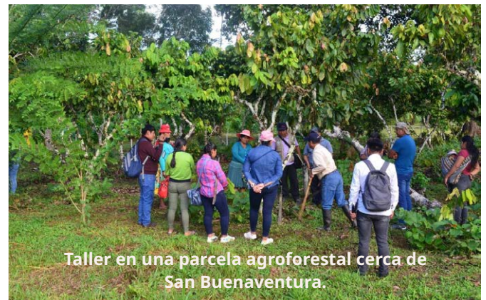
Taller en una parcela agroforestal cerca de San Buenaventura.

con orientación y asesoramiento sobre la gobernanza de la tierra, o en la revisión de sus estatutos y reglamentos de gestión; es el caso, en particular, de la federación provincial de sindicatos de productores FESPAI (principalmente migrantes andinos) y de la organización indígena CIPTA.