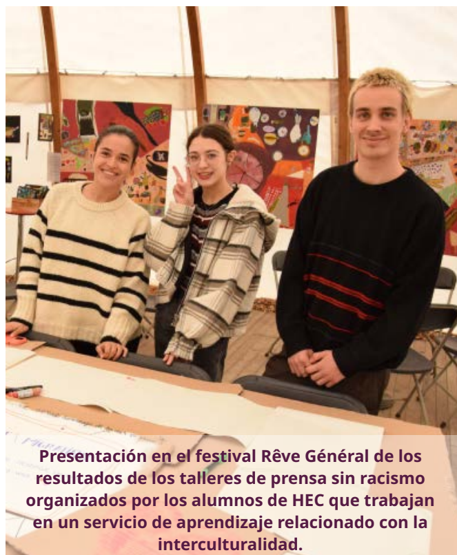
Presentación en el festival Rêve Général de los resultados de los talleres de prensa sin racismo organizados por los alumnos de HEC que trabajan en un servicio de aprendizaje relacionado con la interculturalidad.