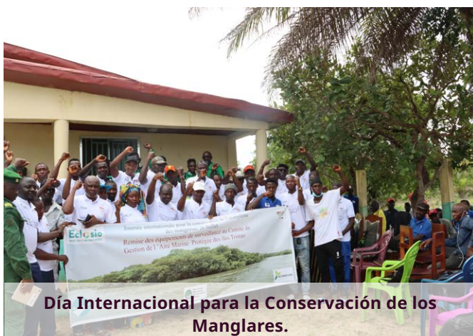
Día Internacional para la Conservación de los Manglares.

Para más información: https://festivalmangal.mangroves.network/