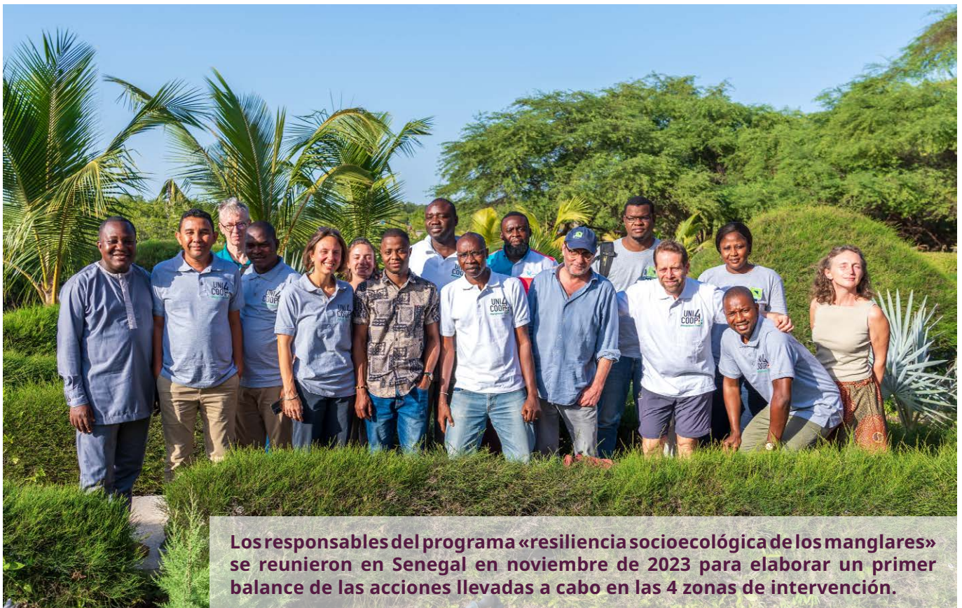
Los responsables del programa «resiliencia socioecológica de los manglares» se reunieron en Senegal en noviembre de 2023 para elaborar un primer balance de las acciones llevadas a cabo en las 4 zonas de intervención.