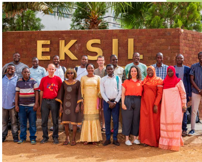
Participantes en las Comunidades de Aprendizaje y Práctica, reunidos en Thiès en julio de 2023.

En 2023, Eclasio también creó Comunidades de Aprendizaje y Práctica (CAP), que reúnen a profesionales del desarrollo de diferentes países del continente africano, así como de Haití y Bélgica, en torno a 4 temas: la agroecología, la gestión de los recursos naturales, la agrosilvicultura/gestión forestal y la implicación de los grupos destinatarios. Los CAP se reunieron virtualmente durante varias semanas antes de reunirse en Thiès (Senegal) del 10 al 14 de julio. Juntos, los participantes pudieron compartir problemas y co-construir soluciones para mejorar sus estrategias y la puesta en marcha de sus proyectos.